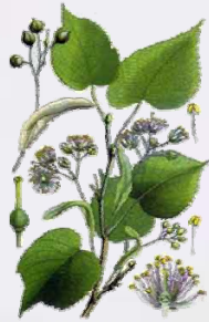
TILLEUL Tilia platyphyllos Inflorescence