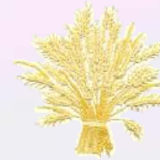
BLE Triticum vulgare Grain et son