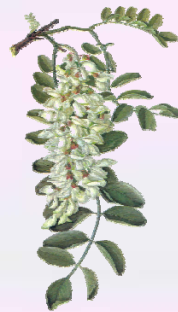
ACACIA Robinia pseudo-acacia Fleur