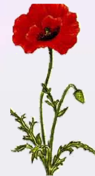
COQUELICOT Papaver rhoeas Fleur (pétale)