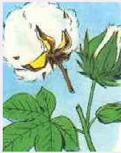
COTON Gossypium Fruit