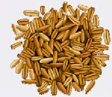
AVOINE Avena sativa Grain