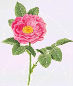
ROSE Rosa centifolia Fleur