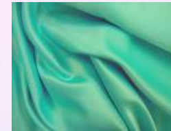
SOIE Bombyx mori Fibre du ver à soie