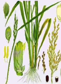
RIZ Oryza sativa Grain